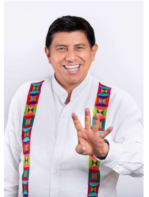
SALOMÓN JARA CRUZ MORENA-PT-PVEM-PUP