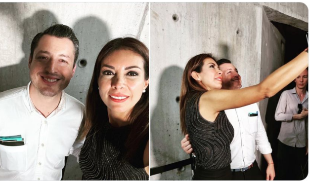
7:31 PM · May 8, 2022 · Twitter for iPhone