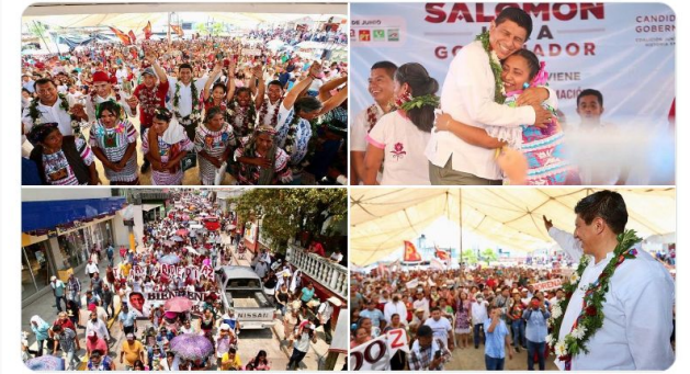
4:18 PM · May 7, 2022 · Twitter for iPhone