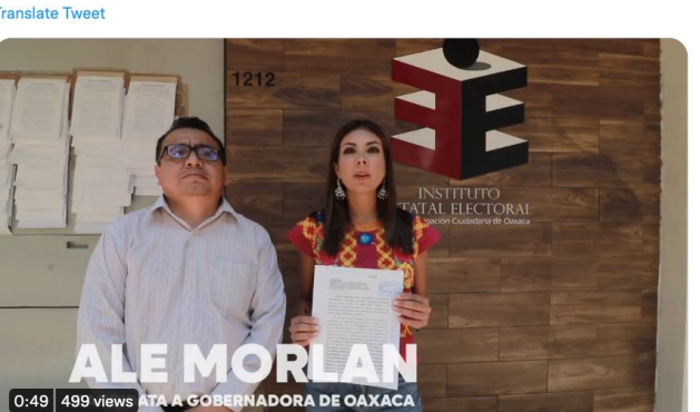
8:09 PM · May 6, 2022 · Twitter Web App

Ale Morlan @alemorlanmx Siempre estaremos del lado de las y los oaxaqueños. Hoy el @TEEOax anuló la decisión de la Comisión Temporal de Comunicación del @IEEPCO de no reprogramar el primer debate a la gubernatura de #Oaxaca, pues su cancelación tiene repercusiones en la contienda.