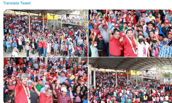
4:49 PM · May 8, 2022 · Twitter for iPhone

Alejandro Avilés Álvarez @AvilesAlvarez Este domingo en San Agustín Loxicha, refrendé mi compromiso con los pueblos indígenas y afroamericano: en mi gobierno crearemos el Instituto Estatal de Lenguas Indígenas para preservar cada una de las lenguas maternas de las diferentes regiones. (1/2)