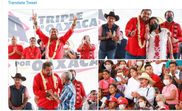
4:49 PM · May 8, 2022 · Twitter for iPhone

Alejandro Avilés Álvarez @AvilesAlvarez También respetaremos sus tradiciones, usos y costumbres, e impulsaremos a los artistas indígenas. ¡Vamos juntos #AlTriplePorOaxaca! ¡Vota este 5 de junio por #ElTripleAGobernador! (2/2)