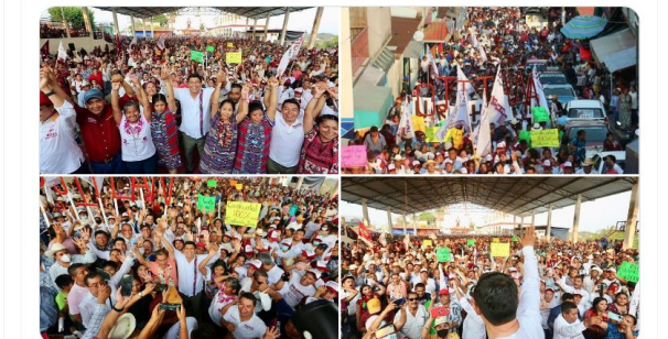
9:36 PM · May 7, 2022 · Twitter for iPhone