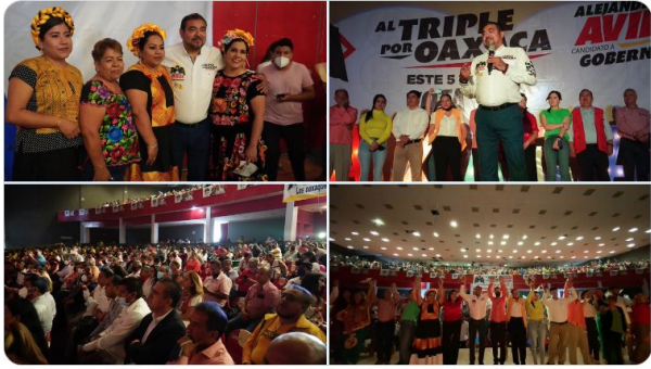
8:37 AM · May 7, 2022 · Twitter Web App